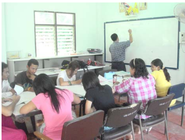
การเรียนการสอนนักศึกษาสายสามัญ ศรช.บางมะพร้าว นักศึกษา ศรช.บางมะพร้าว