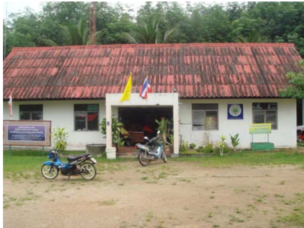
ภาพ ศรช.บางมะพร้าว (ด้านหน้า)