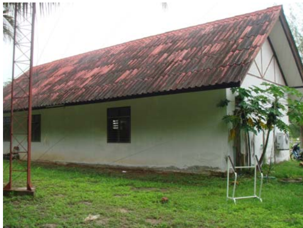
ภาพ ศรช.บางมะพร้าว (ด้านหลัง)