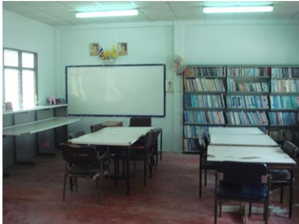
หนังสือสำหรับนักศึกษาชั้นเรียน