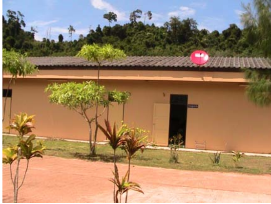
ด้านหน้าศูนย์การเรียนรู้ชุมชนตำบลปากน้ำ