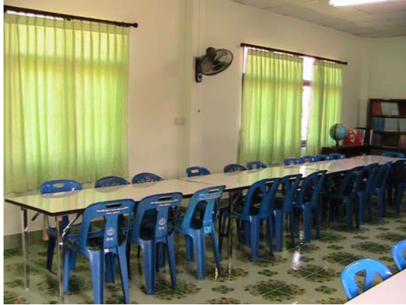
มูมนั่งเรียนพบกลุ่ม