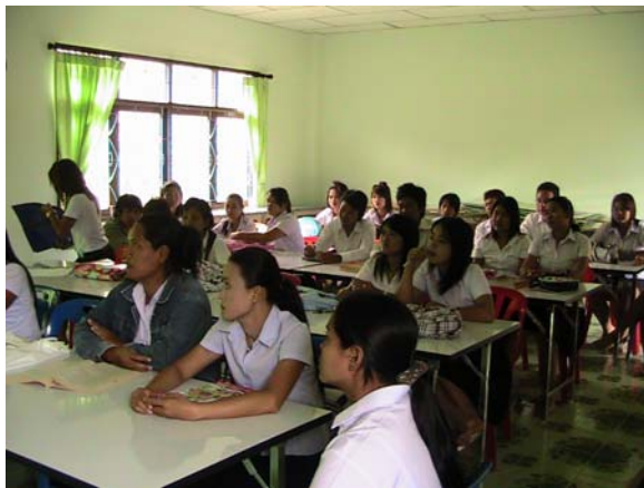
บรรยายภาค ห้องเรียนทุกวันอาทิตย์