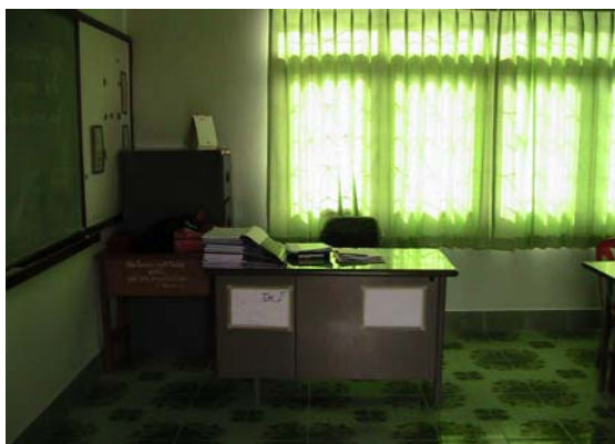
บริเวณด้านใน