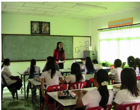
บรรยายภาค ห้องเรียนทุกวันอาทิตย์