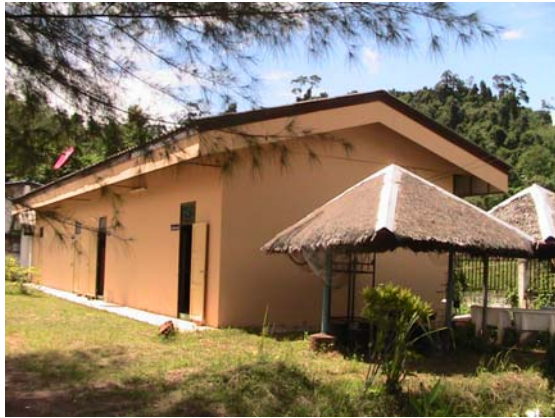
ด้านข้างศูนย์การเรียนรู้ชุมชนตำบลปากน้ำ