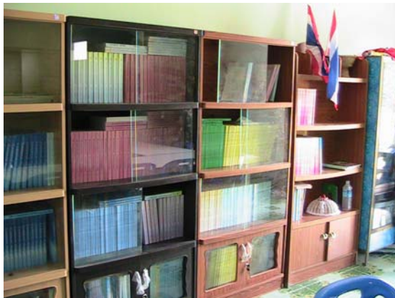
มุมสื่อแบบเรียน