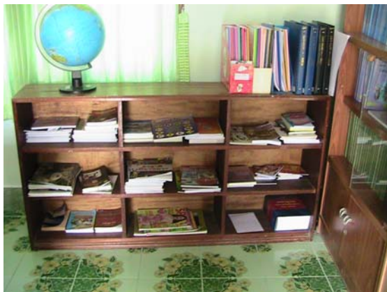
มุมหนังสือนอกเวลา