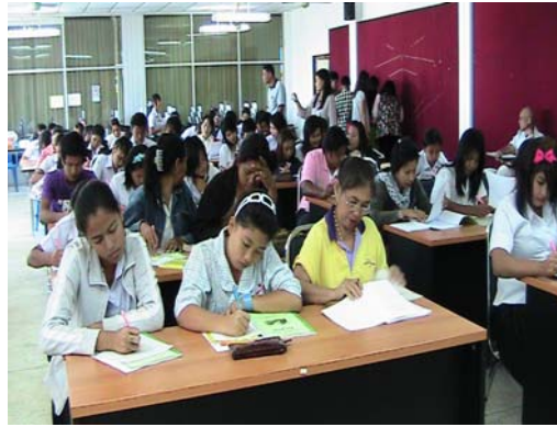
นักศึกษา ร่วม ค่ายภาษาอังกฤษ รุ่นที่ 1