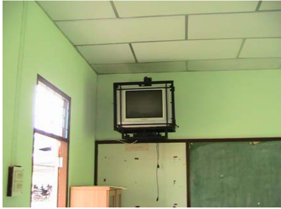
ข่าวสาร ด้าน ICT