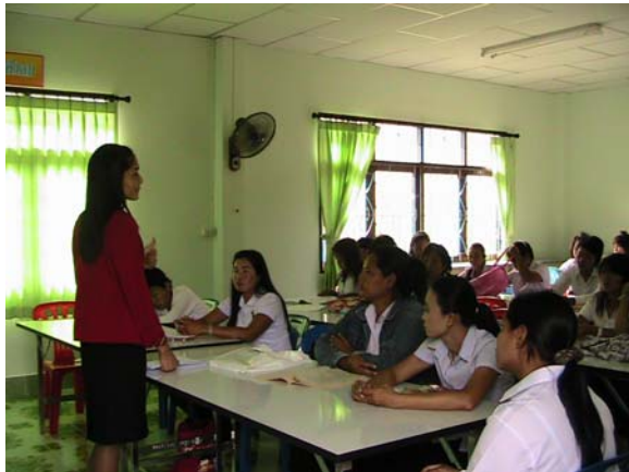
บรรยายภาค ห้องเรียนทุกวันอาทิตย์