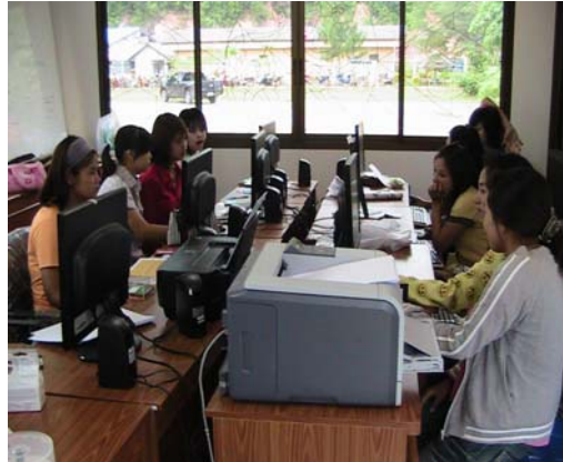
ร่วมเรียน ICT รุ่นที่ 1 กสน.ปากน้ำ