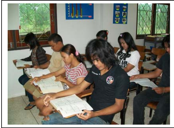
พบกลุ่มนักศึกษา ศรช.ปากคลอง