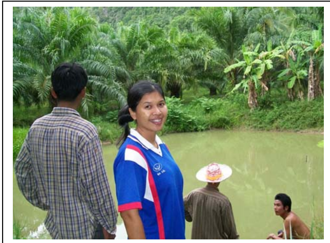
ทักษะอาชีพ กลุ่มเลี้ยงปลาคุกในบ่อดิน