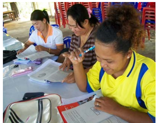
พบกลุ่มนักศึกษาสายสามัญ สถานีอนามัยบ้านฉำฉำ