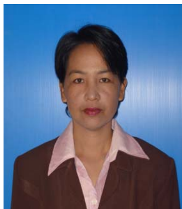
ครูที่รับผิดชอบ ศรช.ตำบลพะโต๊ะ