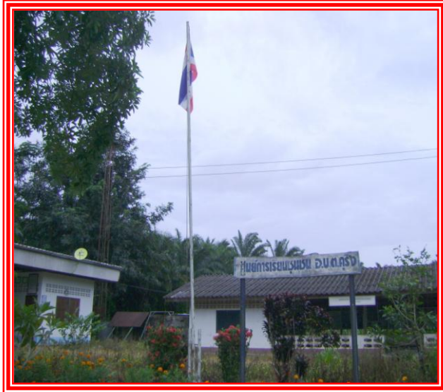
ภาพด้านหน้าศูนย์การเรียนรู้ชุมชนบ้านใหม่พัฒนา