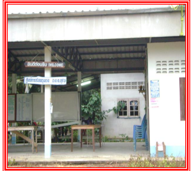
ภาพด้านข้างศูนย์การเรียนรู้ชุมชนบ้านใหม่พัฒนา